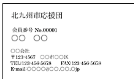
A（名刺：表イラストなし）