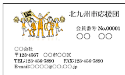
B（名刺：表イラストあり）